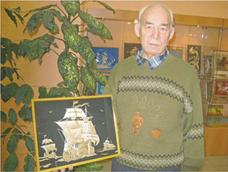
Много таких кораблей уплыло к друзьям и родственникам